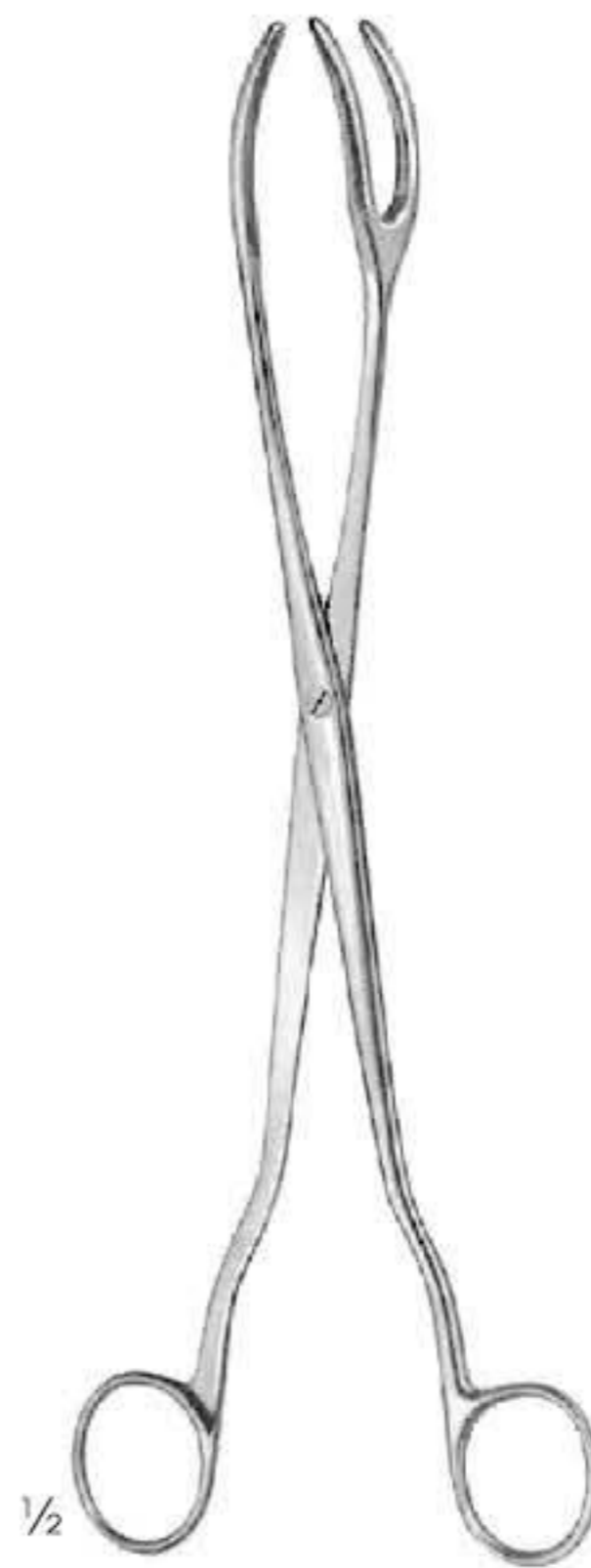
Cheattle 030-0085-27 27 cm/ 10 1/2"